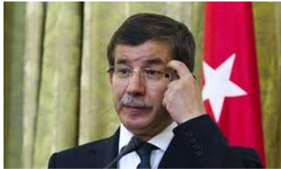
Фиг.5. Архитект на геополитическата концепция на „неосманизма“ е турският външен министър Ахмет Давутоглу.

Редица заявления на Ахмет Давутоглу дават добра представа за концептуалната същност на „неосманизма“: