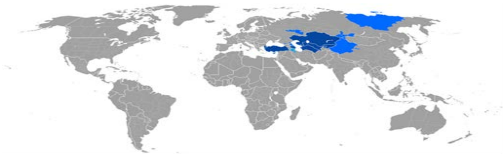
Фиг.3. Карта на разпространението на тюркските народи в глобален план

Тук ще цитираме казаното в италианското геополитическо списание Limes, което в статията си „Завръщането на султана“(Il ritorno del sultano) подчертава следното: «Империиите никога не умират, ако техните основи не са изтръгнати с корена и не са засипани със сол. Техният дух живее в много поколения, както на потомците на господстващите, така и на подчинените народи. Те са готови отново да се възродят при първия удобен случай, само геополитическият натиск над тях да отслабне, а редът, провъзгласен за вечен, се окаже крехък и разнебитен“. 1