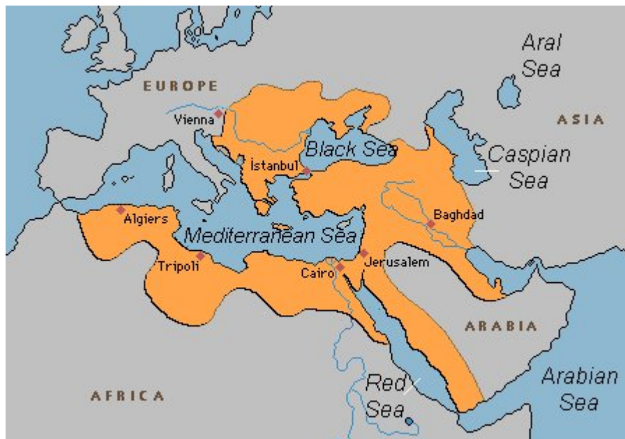
Фиг. 1. Карта на Османската империя

Целите на дадения доклад е да се направи преглед на този феномен, да се синтезират определени реалистични оценки и изводи, както и да се очертаят възможни перспективи и предизвикателства. Тези цели се постигат чрез следните задачи, структурирани в няколко раздела, а именно: