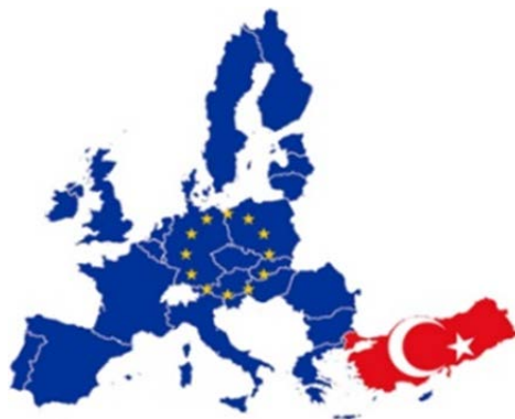
Фиг.4. Турция и ЕС(Европейския съюз)

Определено сред геополитическите фактори, работещи в един противоречив режим на действие може да се спомене също застоялото“ се влизане на Турция в ЕС.