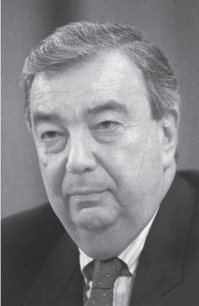
Евгений Максимович Примаков